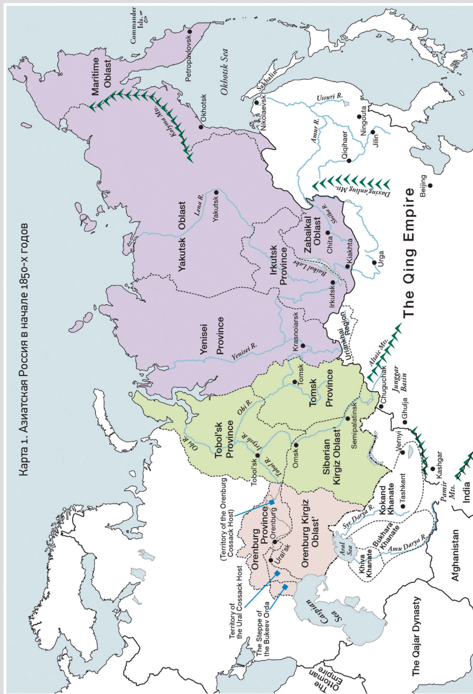
Карта 1. Азиатская Россия в начале 1850-х годов